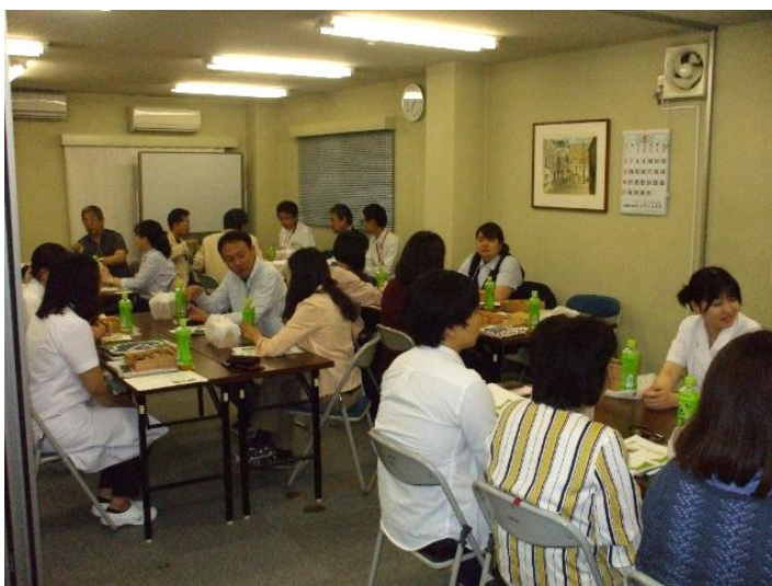
▲ 意見交換会の様子

5月に行いました第2回意見交換会は、患者さまの受け入れに関する質問や連携方法、患者さまを地域で支えていくうえでの役割など、活発な議論が交わされました。